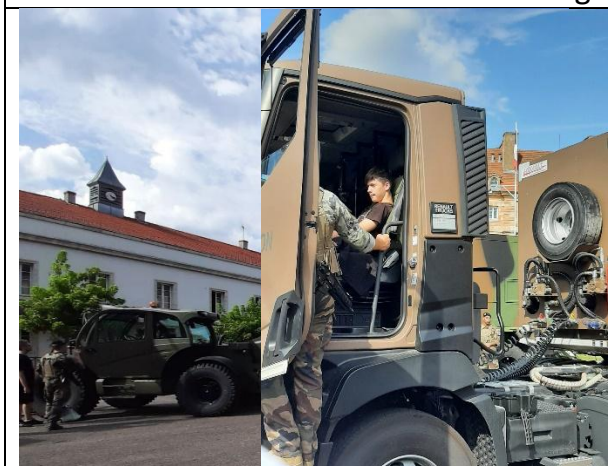
Découverte des véhicules logistique de l'armée