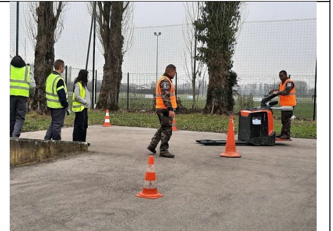
Test et conduite par les militaires de l'escadron logistique, parrain de notre classe défense