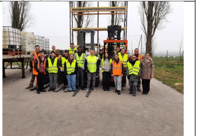
Illustration de notre matinée : Classe défense et parrains réunis