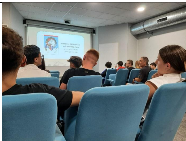
Historique du régiment du train Fonctionnement de l'armée : explication des différents escadrons de ce régiment Objectifs de la classe défense