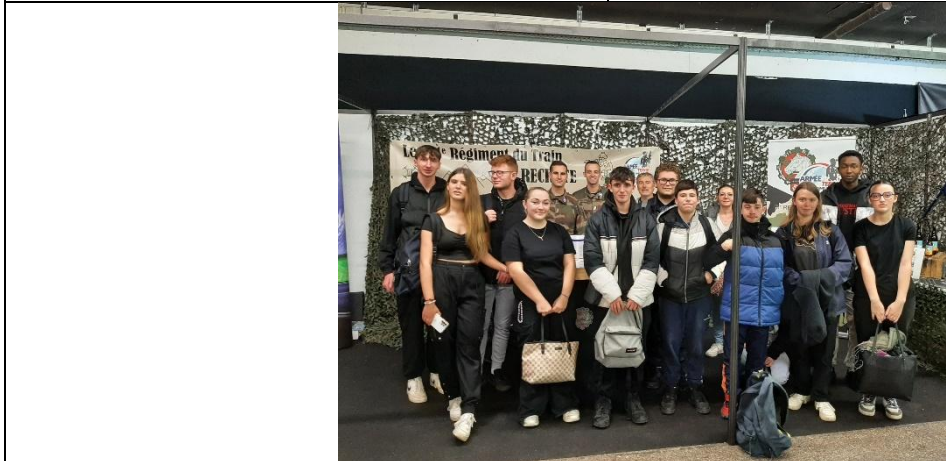
Retrouvailles de nos partenaires à leur stand sur la foire gastronomique de Dijon