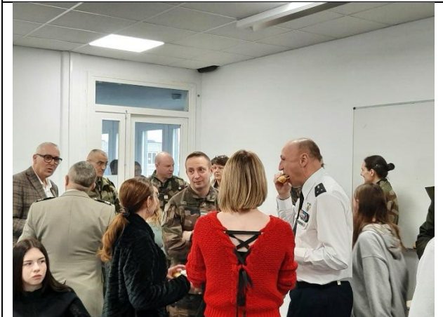
Venue du Général Bourguignon au lycée