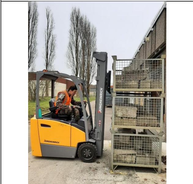
Essai de nos différents engins