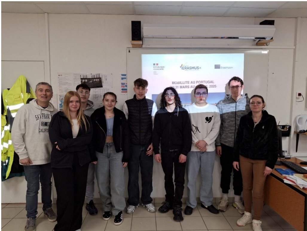
Elèves et professeurs participant à la mobilité Erasmus du lycée Pro 2024/2025

Certains n'ont jamais pris l'avion, d'autres ne sont tout simplement jamais partis en voyage scolaire... Cette mobilité ERASMUS est donc une occasion unique pour ces huit élèves de la section d'enseignement professionnel du lycée Prieur.