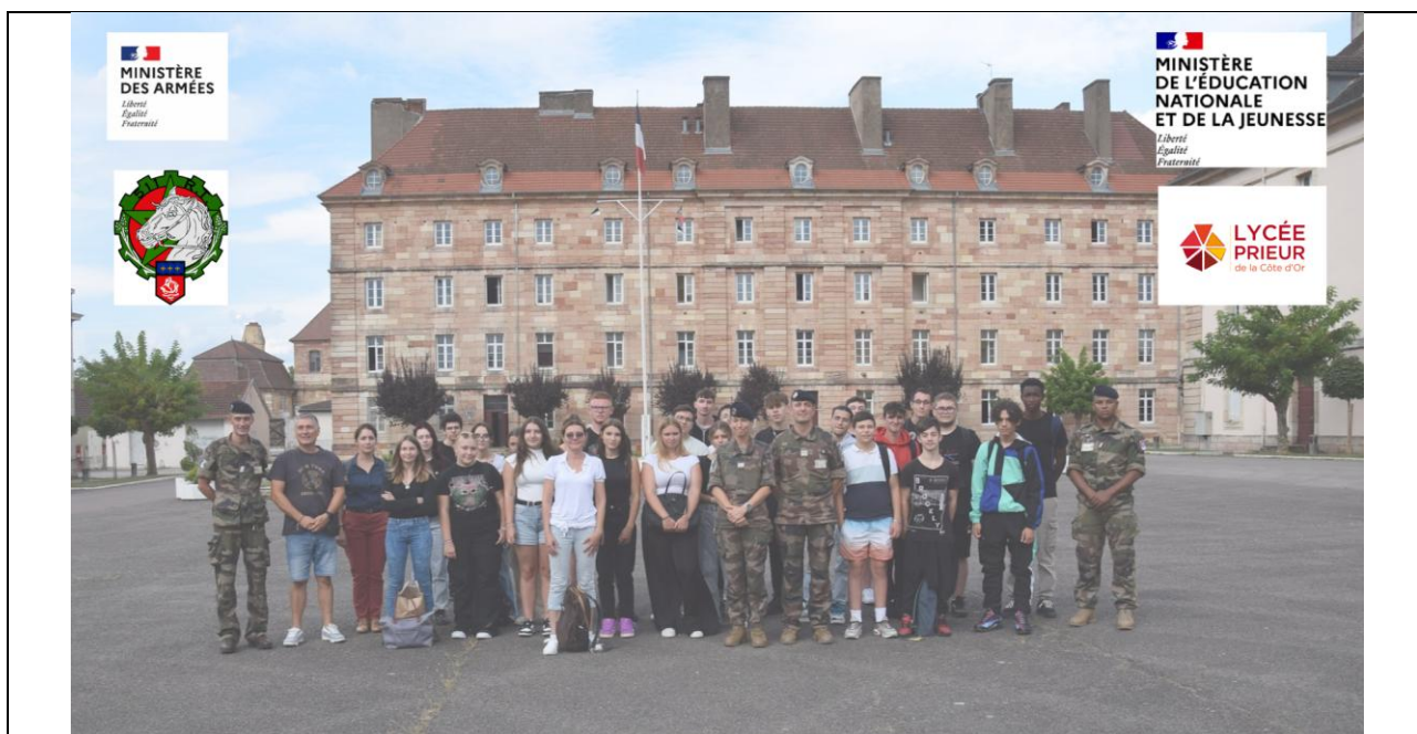
Visite du 511 e régiment du train à Auxonne