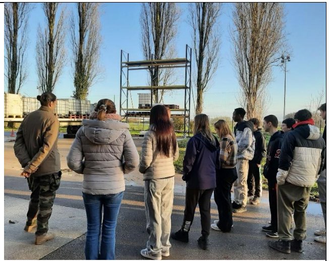
Présentation de nos ateliers matériels logistiques