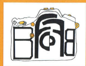
Illustration réalisée par Drilon en CAP1 Logistique